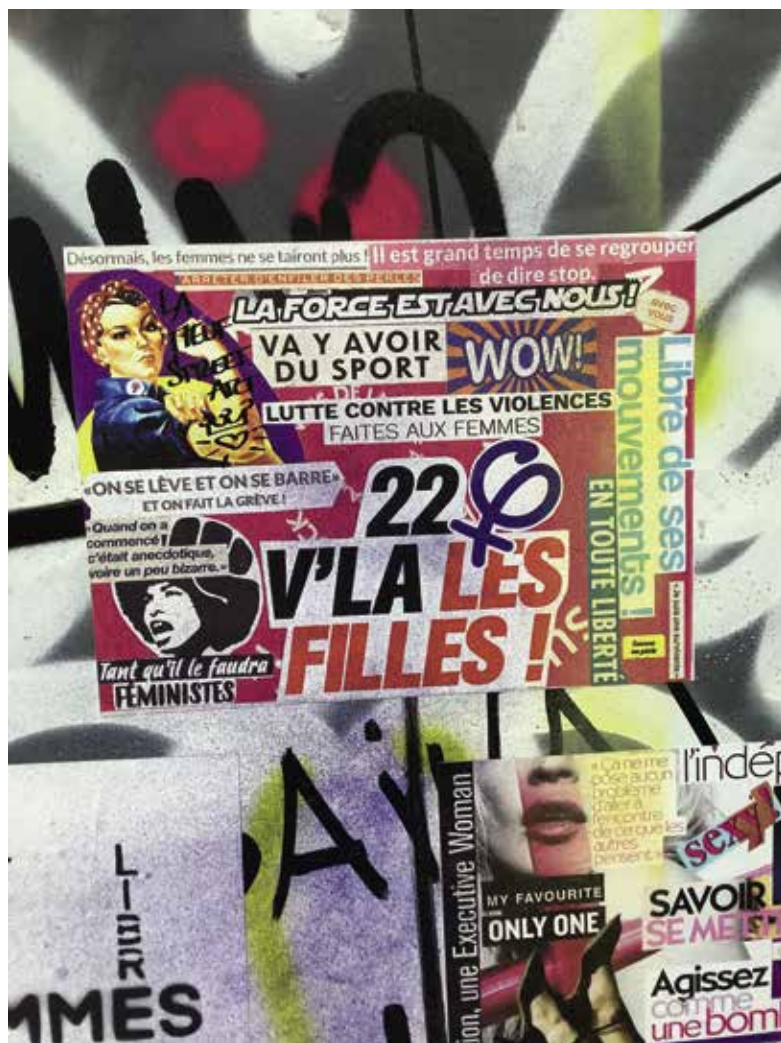
Pas hystériques, mais historiques 1 – Collectif CrrC