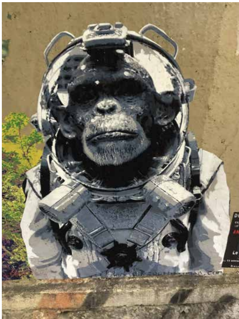
Le progrès – Collectif CrrC